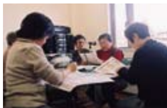
朗読奉仕グループ「水面」