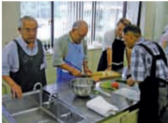
包丁さばきも真剣