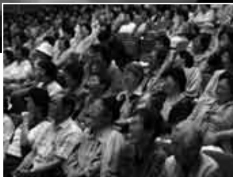
和やかな雰囲気 の客席