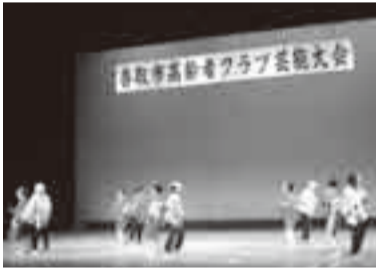
津宮堀川クラブ(団体の部)