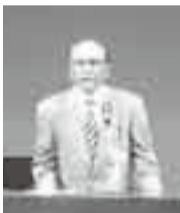
片野会長あいさつ