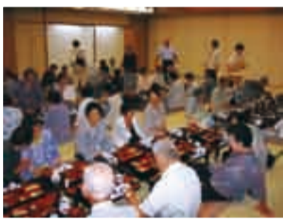
筑波グランドホテルでの昼食

7月6日、第一山倉小学区地区社協でふれあいバスハイキングが実施されバス2台で筑波山へ行きました。地区の一人暮らしのお年寄りや80歳以上の方を招待し、役員を含めて約70人が参加しました。当日は梅雨時にも関わらず晴れ間が見え、初夏の日差しがまぶしい一日となりました。朝8時に山田区事務所を出発。途中大杉神社でトイレ休憩を取り11時過ぎには、昼食場所のつくばグラウンドホテルに到着しました。