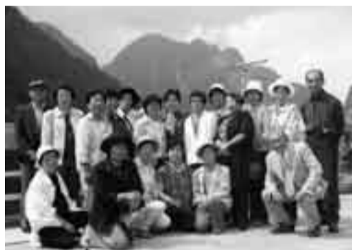
黒部ダムで全員集合