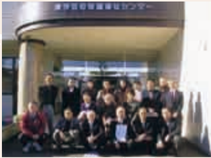
▲東伊豆町保健福祉センターにて

小見川北地区社協では、社協の各種事業に加えて、住民参加による地域ぐるみの福祉推進事業として「歳末気持ち運動」を設立以来毎年、実施しています。これは各戸から100円ずつの寄付金をいただき、それを地域内の一人暮らしの高齢者世帯等への慰問に役立て、地域ぐるみの福祉について、住民みんなが考える機会としています。