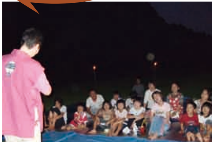
▲平成の森公園で10周年記念口演