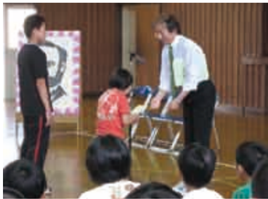
新1年生に登録バッジが手渡される