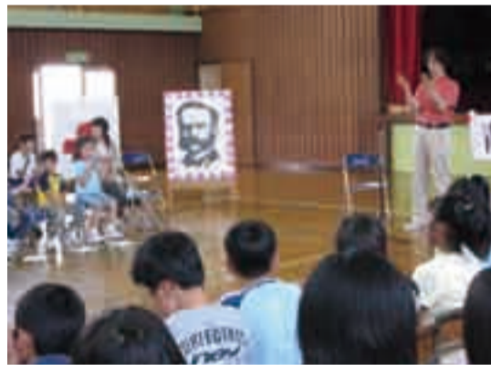
講師も熱心に指導