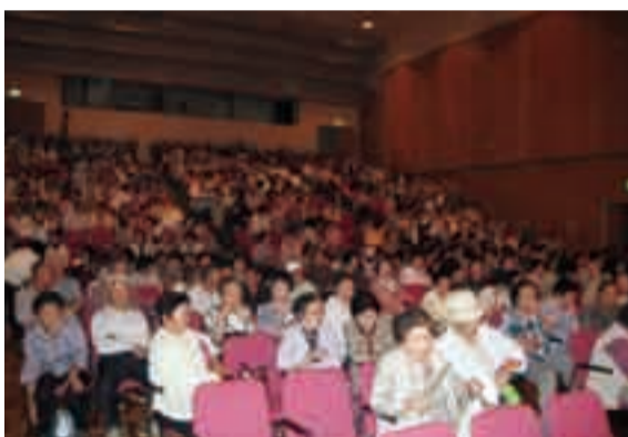
会場には大勢の観客が

県老連主催による「なのはなシニア千葉特選演芸会」が今年も開催され、香取市では佐原・