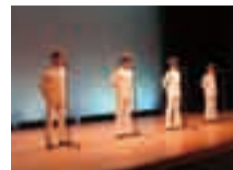
軍歌コーラス若鷹

香取市社会福祉協議会では義援金を募集しております。詳しくは、本所または各支所へお問い合わせください。ご協力をお願い致します。