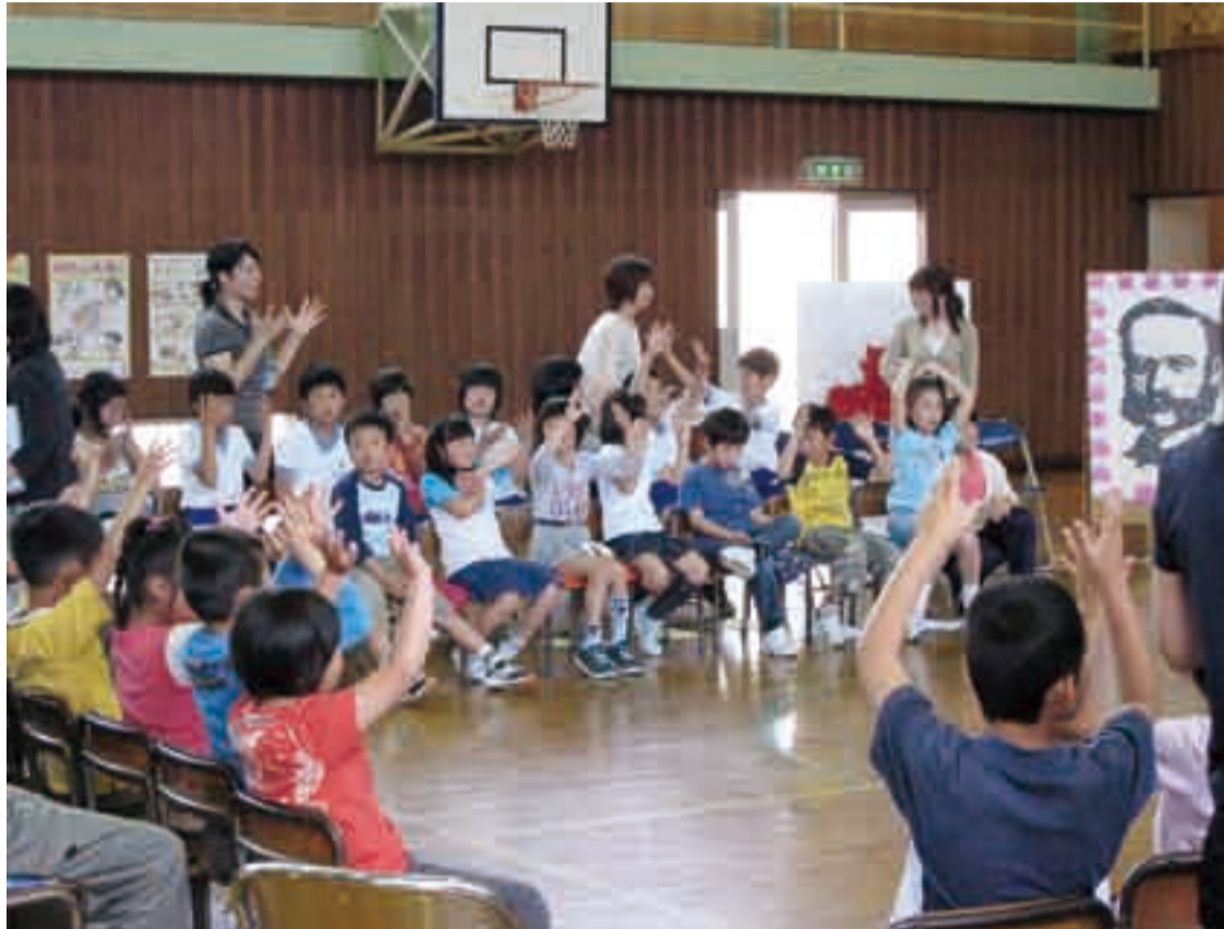
表情豊かに手話を体験する児童

小見川支所…tel 83-7071 山田支所…tel 78-1056 栗源支所…tel 75-2118