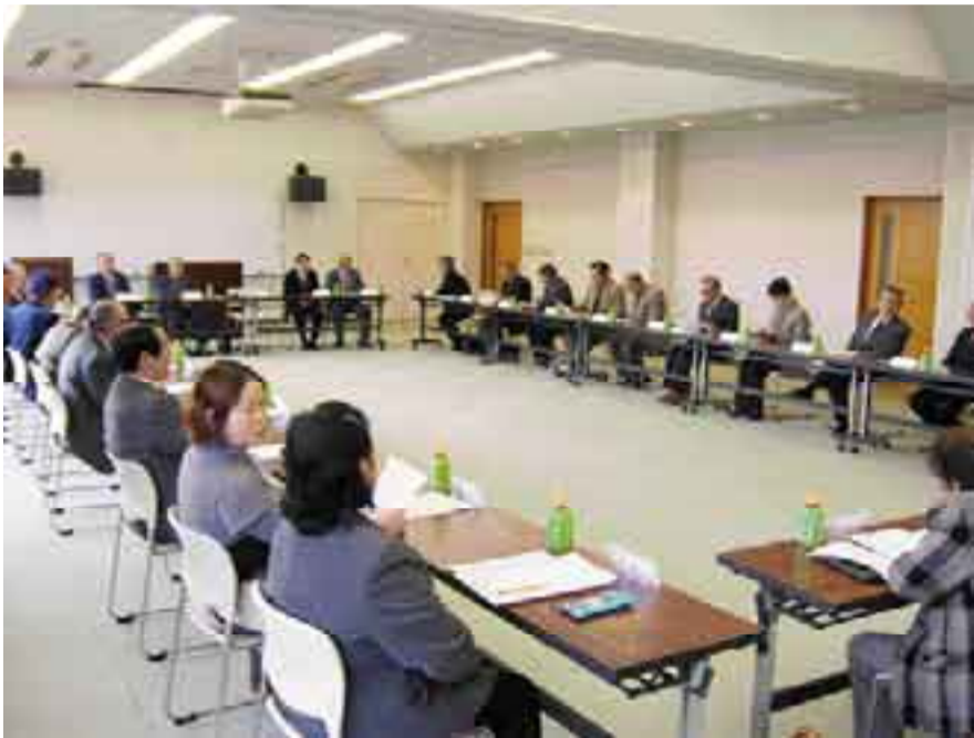
3月に行われた評議員会の様子

特に本年度は、一元化検討委員会が結論づけられた方針を実践する初年度であることから、新たな執行体制のもとで地域住民に対するサービスの質的向上と徹底した歳出の削減に努めるとともに、経営基盤を確固たるものにするため、次の事項を重点に事業活動を進めるものとする。