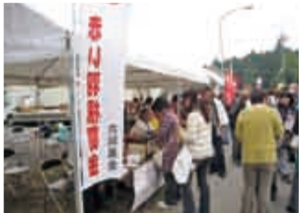
◀11月3日 山田区 山田ふれあいまつりの募金活動