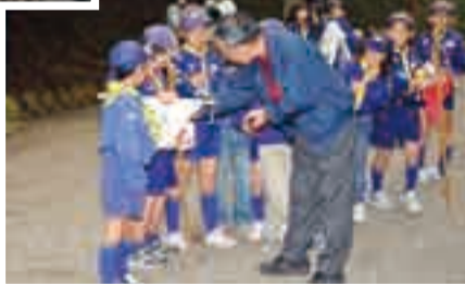
11月7日 佐原区▶ 香取神宮でのボーイスカウトによる募金活動