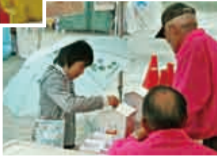
◀11月9日 小見川区 小見川ふるさとまつりの募金活動