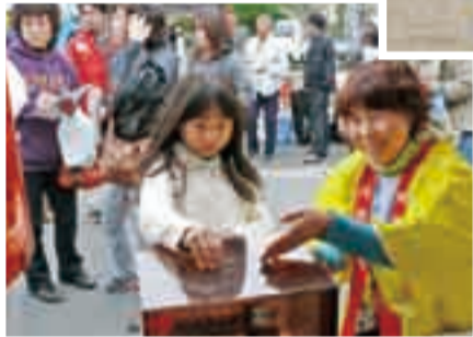
11月16日 栗源区▶ 栗源ふるさととも祭の募金活動