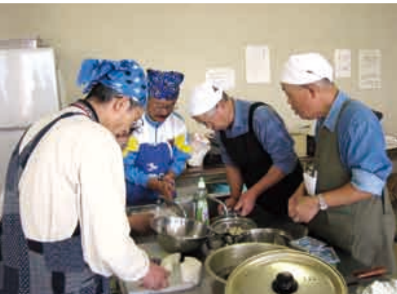
ちょっと心配な手さばき!?

全4回の課程はあっという間で、毎回受講生の皆さんのパワーに圧倒されながら、今年度も無事終了することができました。