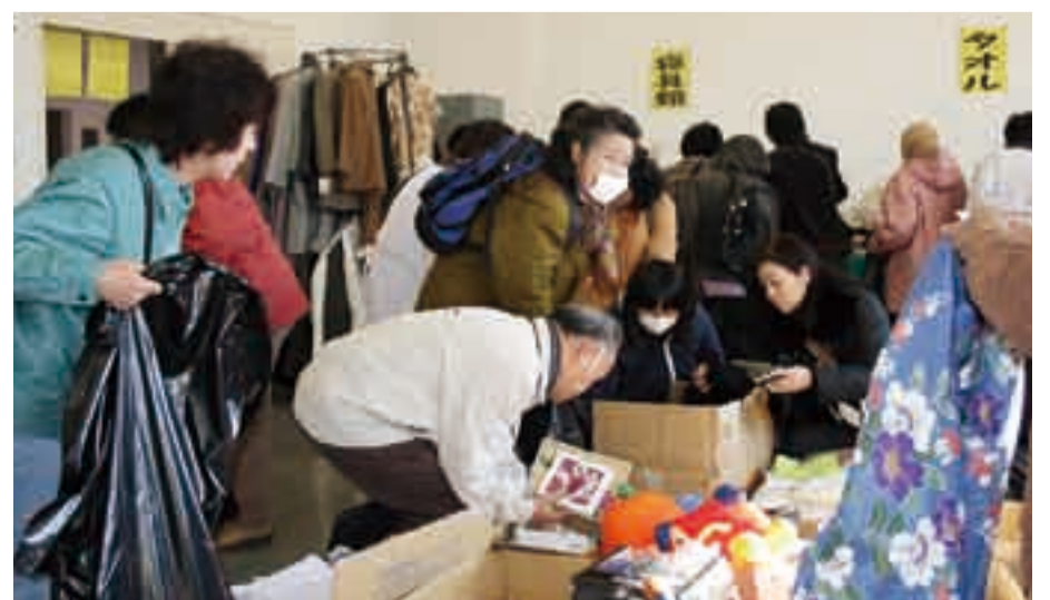
来場者で賑わう会場

当日は好天にも恵まれ早朝から大勢のお客様で場内は熱気に溢れていました。協力してくださった区長さんはじめボランティアの皆様にご感謝申し上げます。