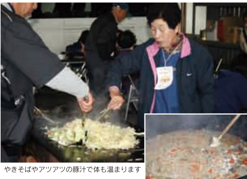
やきそばやアツアツの豚汁で体も温まります

また、歌謡ショーや抽選会なども行われ、子どもからお年寄りまで地区の絆が深まった一日でした。