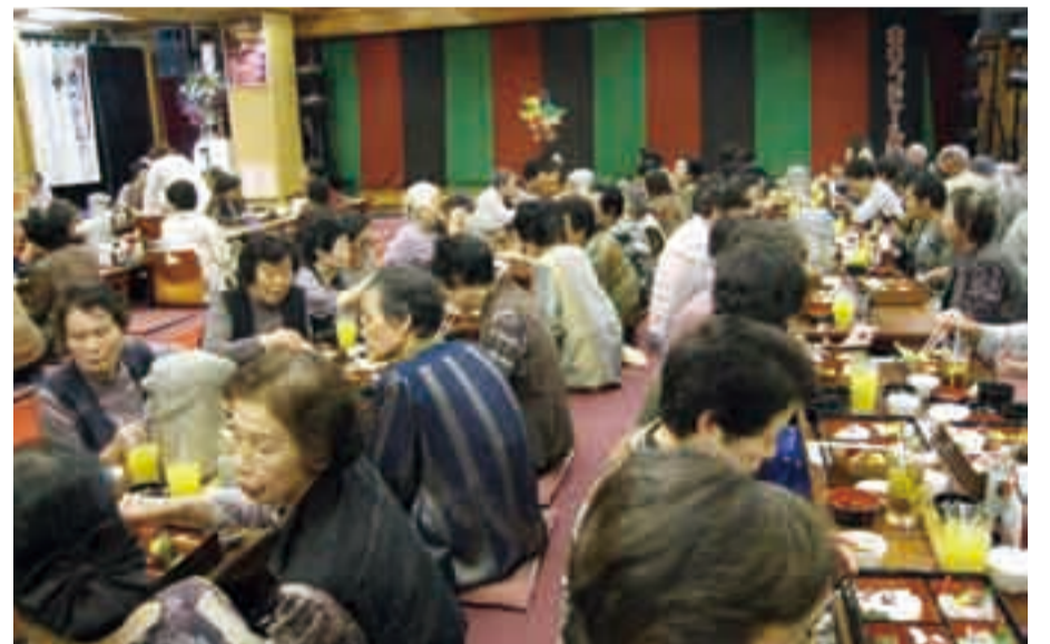
アゼロン神の栖での懇親会