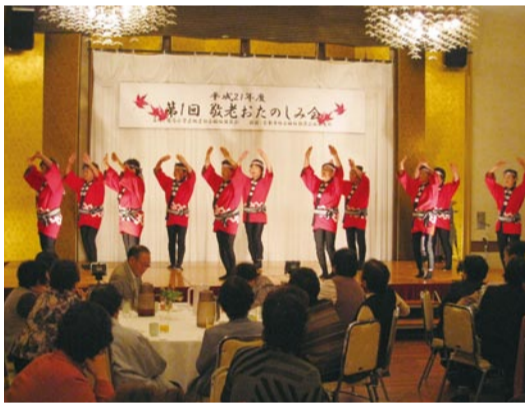
府馬小学区地区社協 敬老おたのしみ会

今年も山田区の地区社協ではお年寄りを対象にしたバスハイキングや敬老会を実施し、楽しいひと時を過ごしました。