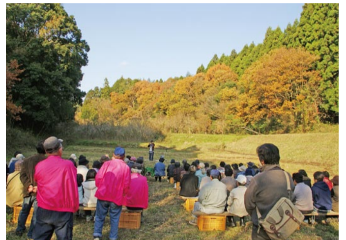
会場は紅葉に囲まれたステージ