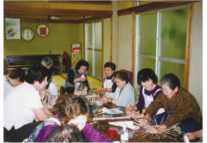
女性委員とミニデイサービス参加者

高齢者クラブ山田支部の女性委員は、香取広域老人福祉センターで9月から月に一度ミニデイサービスのお手伝いをしています。手遊びや、広告紙を細く棒状にしたかご作り、軽い運動等ヘルパーさんが考えてくれたものを参加者と共に楽しく行い、有意義な時間を過ごしています。