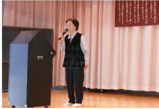
自慢の唄声を披露

9月30日、香取広域老人福祉センターにおいて香取市高齢者クラブ連合会カラオケ大会が開催されました。大会には48人が参加、日頃の練習の成果を熱唱しました。この大会の上位4人は、11月6日八千代市民会館で行われた、千葉県老人クラブ会員カラオケ大会に出場し、大舞台上で堂々と唄い大きな拍手をいただてきました。