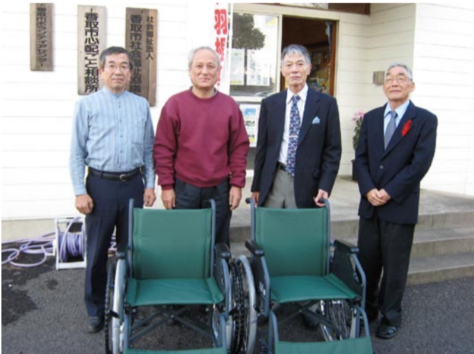
寄贈された2台の車いす