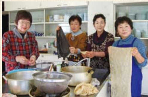
身近な自然がいろいろな色彩へ

地域活性化推進事業の一団体として、昨年からはボランティア栗源の皆さんが取り組んでいるのは草木染めです。勉強中のインストラクターは身近な自然をふんだんに使って様々な色彩の染色を楽しんでいます。最近の傑作は紫ツツジ、想像以上にやさしいピンク色に染まりました。「地域の豊かな自然を生かした草木染めを大勢の方に楽しんでいただきたい」とインストラクターの皆さんは話しています。