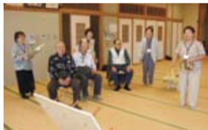
ミニテイサービス