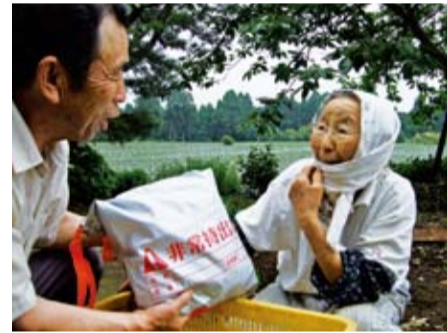
ひとり暮らし高齢者に民生委員が緊急持ち出し袋を贈呈

千葉県では平成16年に策定された「千葉県地域福祉支援計画」の中で『誰もが、ありのままに、その人らしく、地域で暮らすことができる』新たな地域福祉像が示されました。新たな地域福祉像ではこれまでの地域づくり・まちづくりには「地域住民一人ひとりが主役」となり新しい地域社会をつくるべく、いくことが重要とされています。