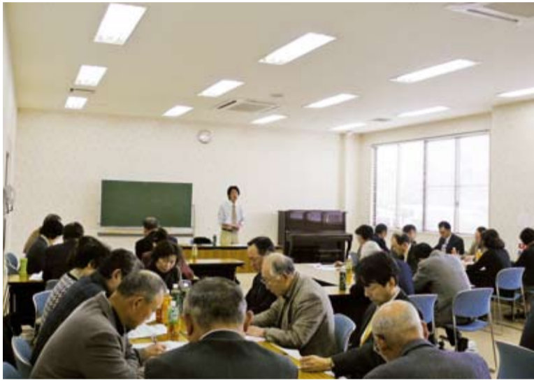
各地区社協毎のグループ討議