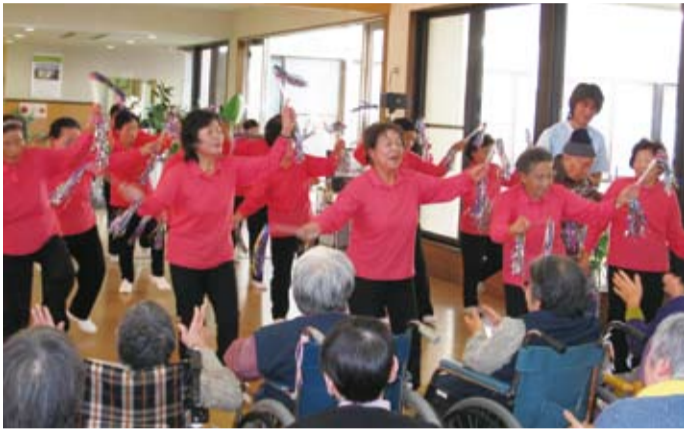
ボランティア活動（施設慰問）