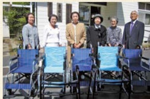
佐原婦人会館運営委員のみなさん

昭和26年4月の発足以来50余年の長きにわたり活動され、昨年3月に解散した佐原婦人会館運営委員会より車イス5台、歩行器2台が寄贈されました。