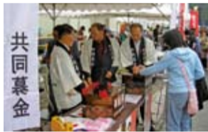
共同募金（街頭募金）