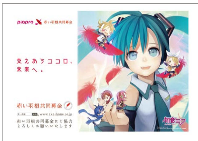
Illustration by (Kenji) © Crypton Future Media, INC. www.piapro.net piapro piapro