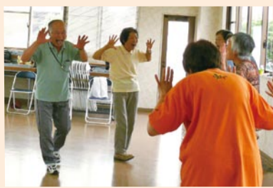
写真は、ライオン笑いをしている様子で、威嚇するように両手を上げ、舌を思いっきり出し仲間の顔を見て笑い合います。

大勢でゲラゲラ笑うことがポイントで、ヨガの呼吸法を組み合わせることでストレスが解消されます。今後、社会福祉協議会のミニデイサービスでも取り入れていく予定です。