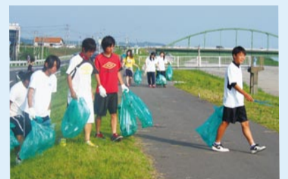
水郷おみがわ花火大会の翌日に清掃活動をする生徒たち

ボランティア活動は気恥ずかしいと思う人もいるようですが、これからも仲間とともに、地域の方々や福祉施設の方々とのふれあう機会に積極的に参加し、これらの経験を自分自身の成長にも繋げていきたいと考えています。