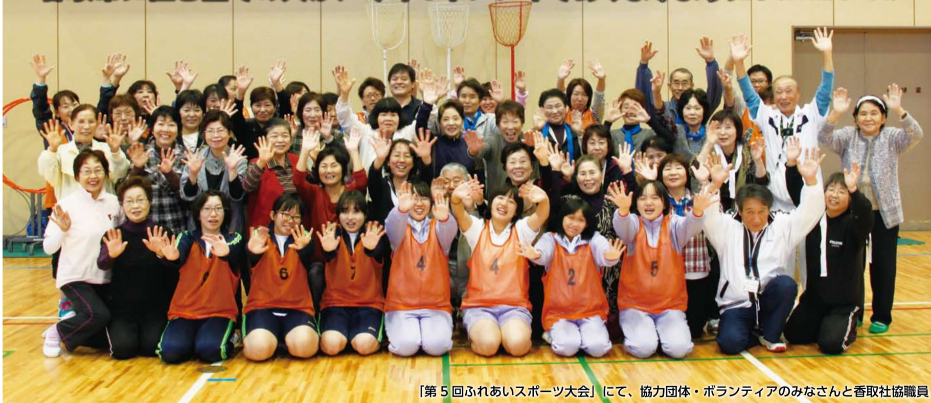
「第5回ふれあいスポーツ大会」にて、協力団体・ボランティアのみなさんと香取社協職員