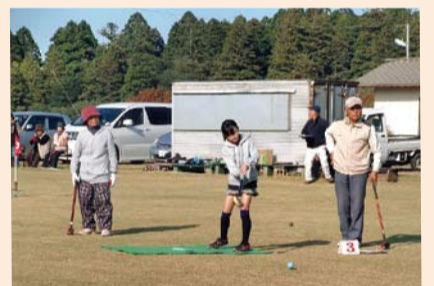
いろいろな世代と一緒にプレー

地区の小学生から高齢者まで約50名が集まり、和気あいあいとグラウンドゴルフをプレー。小学生達はルールや打ち方を教えてもらいながら楽しい時間を過ごしました。