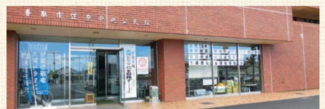
ボランティアセンター外観

ボランティア派遣の要望のあった場所やお宅に伺い、瓦礫の撤去や清掃などのお手伝いをします。