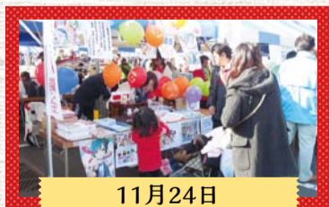
11月24日 ふるさとフェスタさわら