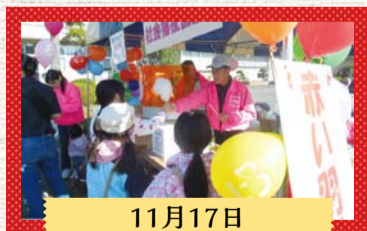
11月17日 栗源のふるさといも祭