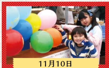
11月10日 おみがわYOSAKOIふるさとまつり