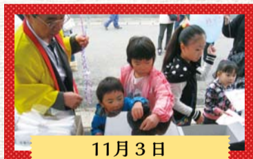
11月3日 山田ふれあいまつり

10月から12月にかけて共同募金活動を実施し、市民のみなさまをはじめ大勢の方々からたくさんの募金が寄せられました。また、各区で行われたイベント会場では街頭募金も実施し大勢の方々にご協力いただきました。ありがとうございました。共同募金の実績は次号でお知らせいたします。