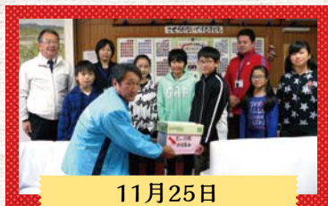
11月25日 小見川中央小学校