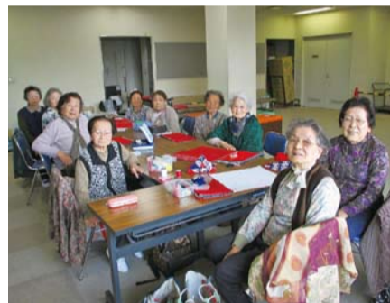
生きがい活動支援通所事業(ミニデイサービス)