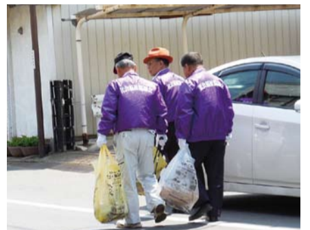
新宿地区社協による清掃作業