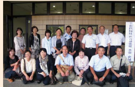
当日参加した地区社協のみなさん

この大会は、平成24年度に福祉教育推進指定校・指定団体を受けた学校と地域が3年目を迎えるに当たり、今までの活動の成果と今後の課題について実践発表を行うもので、香取市では指定を受けた、小見川高等学校・山田中学校・府馬小学校・府馬小学区地区社会福祉協議会が3年間の福祉教育活動を通して、学校と地域の役割、今後の地域に根ざした福祉教育の在り方と重要性について発表をしました。