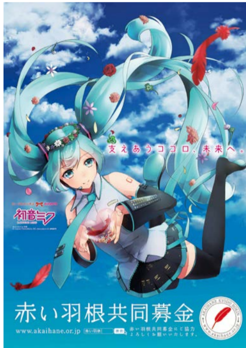
Illustration by 羽音 © Crypton Future Media, INC. www.piapro.net piapro

平成26年度「赤い羽根共同募金」が、今年も10月1日から全国一斉に展開されます。