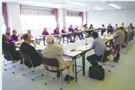
事業内容の説明を受ける出席者

栃木市はここ5年間で3回の市町合併を経験し、今年の4月に3回目の合併をしました。昨年度は合併を控え、その後の取り組み等の視察として本会に受け入れた経緯があります。