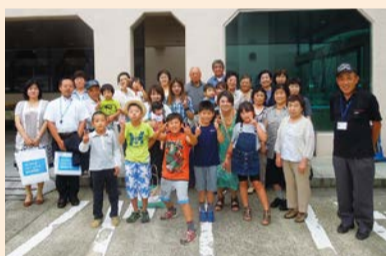
レストハウス前で記念撮影

滑走路から飛行機が離陸するその迫力に参加者は大喜び。大きな歓声が上がっていました。視察後は空港内にある成田エアポートレストハウスにて昼食をとり、最後に航空科学博物館を訪れ、充実した視察研修となりました。