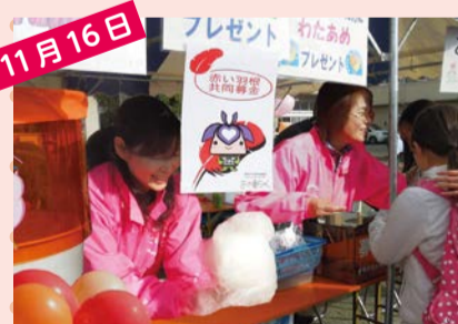
栗源のふるさととも祭