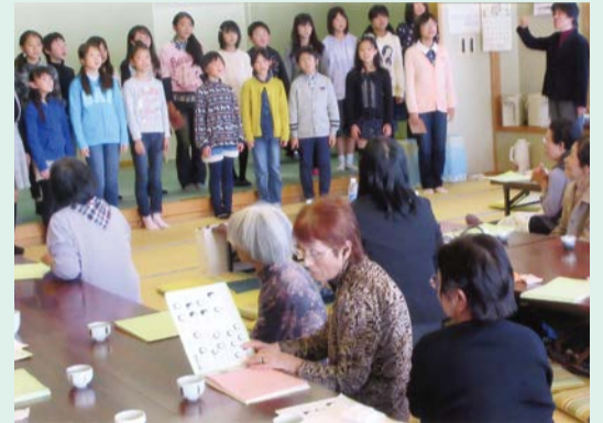
小学生たちからの歌のプレゼント

食事を作ってくれたボランティアの皆さん、送迎や会場内で案内をしていただいた民生委員の皆さん、ご協力ありがとうございました。これからも安全で安心に暮らせる町づくりを目指して頑張ります。