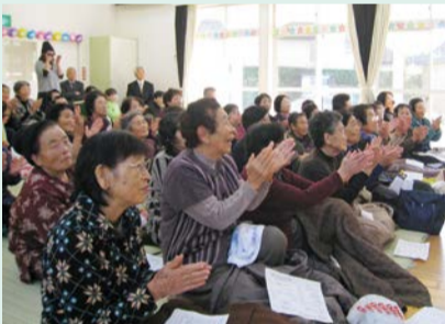
園児のお遊戯にたくさんの拍手が

当日は、園児による歌やお遊戯が披露されました。またボランティアによる手作りまんじゅうなども配られ、賑やかな雰囲気の中で、参加者は楽しいひとときを過ごすことができました。