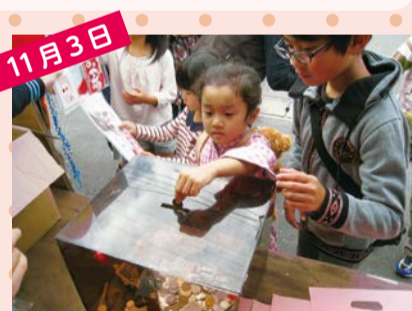
山田ふれあいまつり