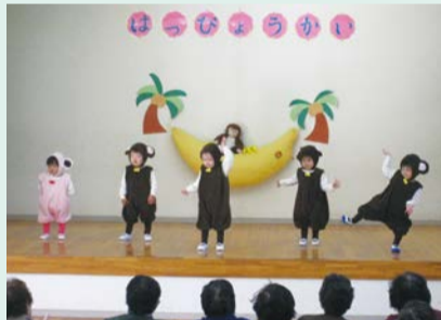
バナナくんたいそう