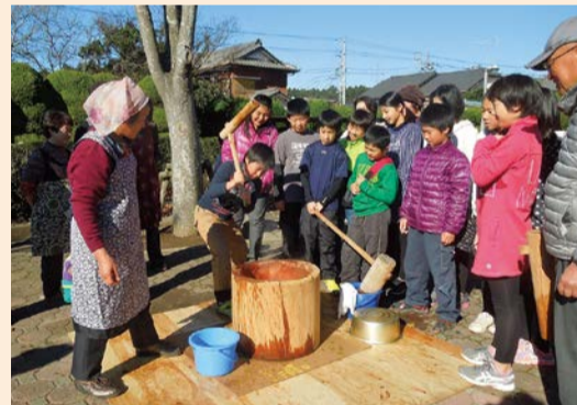
精一杯の力で杵を打つ

周りのみんなが掛け声をかけると、雰囲気は大いに盛り上がり、ひと足早いお正月気分を楽しんだ小学生たちは「みんなで力を合わせてついたお餅は美味しかった。」とお腹いっぱい食べ、新年に向けて意欲満々の表情でした。