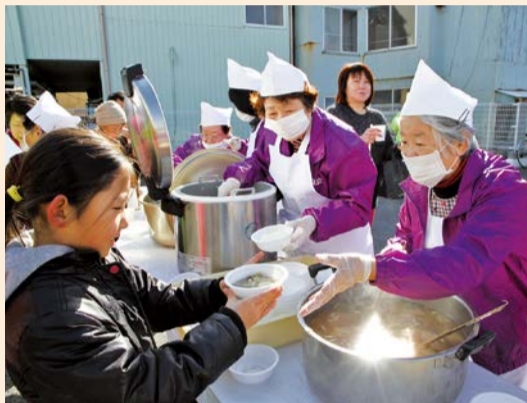
ホッカホカの芋煮のできあがり