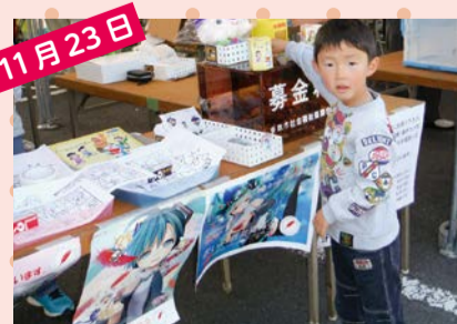
ふるさとフェスタさわら