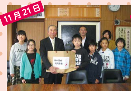
小見川中央小学校