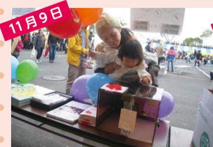
おみがわYOSAKOIふるさとまつり