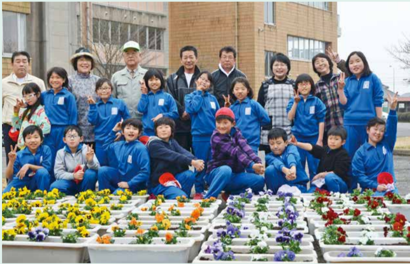
苗植え終了後、記念のピース