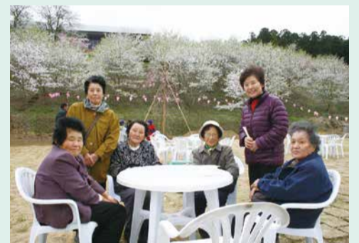
話にも花が咲きます

あいにく花曇りの肌寒い1日でしたが、会員の交流や親睦を図りながら、今後の活動に意欲を燃やしていました。