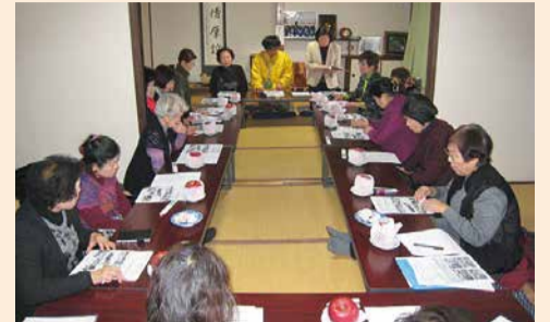
サロン運営の説明を熱心に聞く参加者