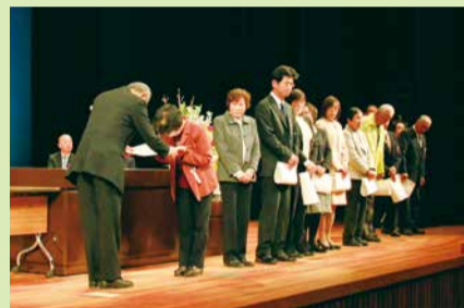
表彰状受け取る受賞者のみなさん