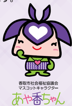
香取市社会福祉協議会 マスコットキャラクター あや香ちゃん

今後は地域福祉を担う社会福祉協議会として障害を持つ方々が生活しやすい地域社会づくりを目指してまいります。