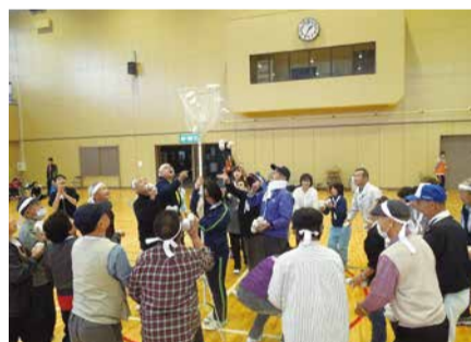
ふれあいスポーツ大会