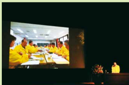
東大戸地区社協会長による活動体験発表