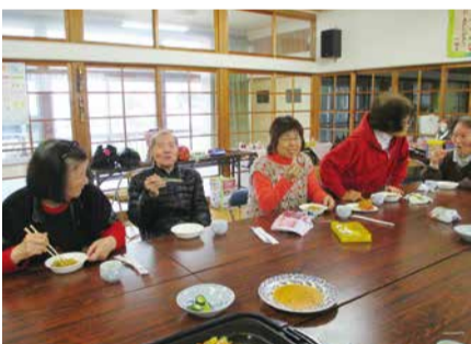
ミニデイサービス