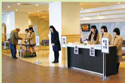
千葉朝陽高校ボランティア部のみなさんによる受付