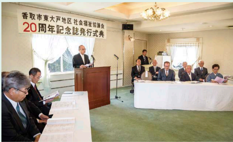
吉田会長からの挨拶