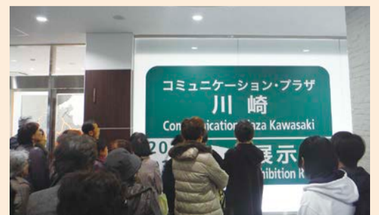
大きな看板を見上げる参加者