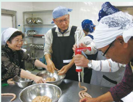
羊腸へ詰める行程

参加した皆さんは、手作りのソーセージと米粉パンのお土産を持ち帰り、立ち寄ったシャトーカミヤでお好みのワインを買うなど、嬉しそうな参加者の笑顔が印象的な研修となりました。