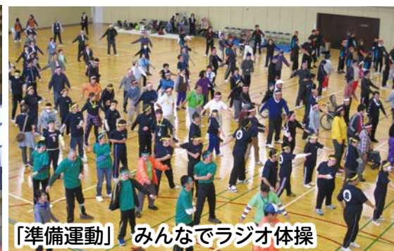
「準備運動」 みんなでラジオ体操