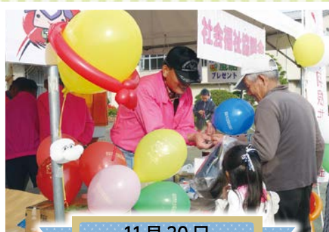
11月20日 栗源のふれさといも祭