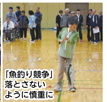
「魚釣り競争」 落とさないように慎重に