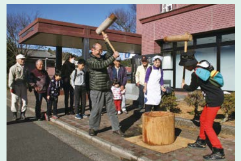
腰を入れて力強く!

つき終わってからは、あんこ餅やお雑煮が振る舞われ、年男年女の皆さんは自分でついたお餅を味わいながら、一足早い新春気分を楽しみました。