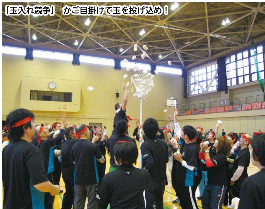
「玉入れ競争」 かご目掛けて玉を投げ込め!

朗読奉仕水面の会・レインボーグループ・西地区婦人ボランティア・手話サークル千の風・喜楽会・おもちゃ図書館どんぐり・千葉萌陽高校ボランティア部・新宿地区社会福祉協議会・香取ネットワーク・男性ボランティアグループ ほか