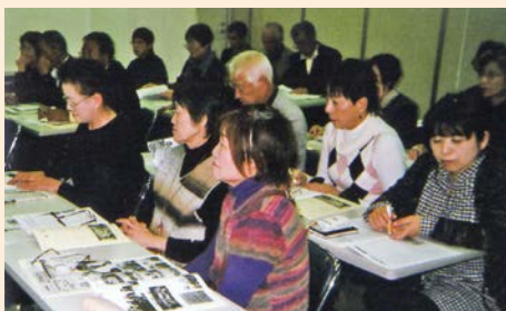
サロン活動視察での勉強会のような様子

小見川中央地区社協は、10月21日に、小見川駅前の空き室を借りて『サロンくろべ』を開設しました。人が集い、「仲間づくり」、「健康づくり」につながる楽しい場所を目指して、現在月に1回第3金曜日に開催しています。