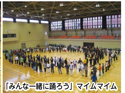
「みんな一緒に踊ろう」 マイムマイム