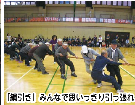
「綱引き」 みんなで思いっきり引っ張れ