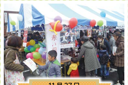
11月27日 ふれさとフェスタさわら