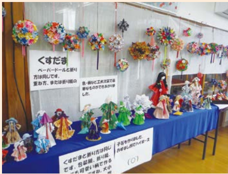
会場にはたくさんの作品が展示

当日は、製作された皆さんも集まってくださり、「(作業が)大変なときには、もうこれでやめようと思うけれど、1つ作品が完成すると、また次が作りたくなるのよ」と笑顔いっぱいに話してくださいました。