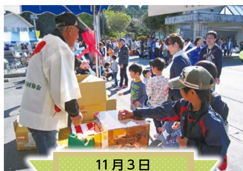
11月3日 山田ふれあいまつり

募金をしていただいた市民の皆さまはもちろん、各自治会、民生児童委員、各法人・職場、街頭募金にご協力いただいたボランティア等々、募金活動に係わっていただいた方々に心よりお礼申し上げます。皆さまからご協力いただいた善意は、「じぶんの町を良くする」ための福祉活動に活用させていただきます。ありがとうございました。なお共同募金の実績は次号でお知らせいたします。