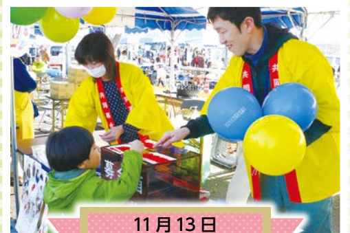
11月13日 おみがわYOSAKOIふれさとまつり