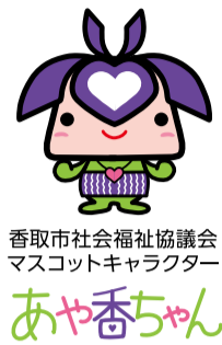
香取市社会福祉協議会 マスコットキャラクター あや香ちゃん