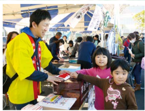
11月12日 おみがわYOSAKOI ふるさとまつり