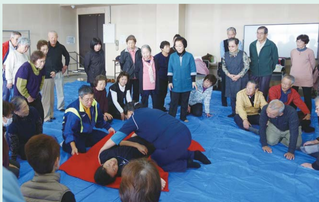
いざという時のために

実技では、倒れていて手当が必要な人の救急隊到着までの体位変換法や毛布の当て方、ガウンのように包んで保温する方法など、声を掛け合いながら楽しく学ぶことができました。また、リラクゼーションマッサージや新聞紙で作るスリッパなど、発災時の避難所だけでなく普段の生活でも使える方法をも学ぶことができました。自分自身を守ることが大前提ですが、近隣同士の助け合いの輪が広がっていく、充実した研修となりました。