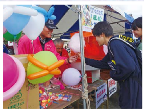
11月19日 栗源のふるさといも祭