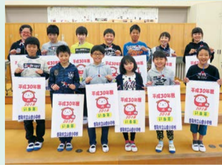
カレンダーの完成です

出き上がったカレンダーは12月に地区社協を通じて、対象家庭に配付されます。手作りの温もりを感じる「福祉カレンダー」は、ひとり暮らしの高齢者に大変喜ばれています。