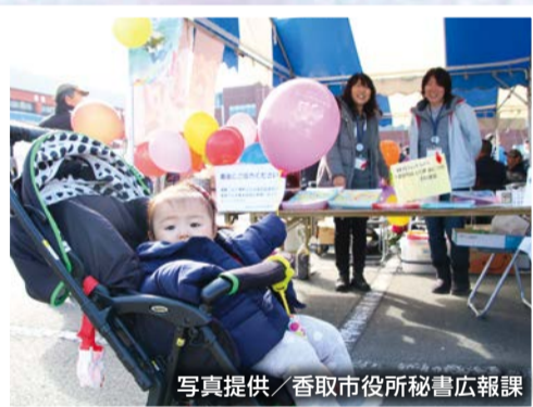
11月26日 ふるさとフェスタさわら