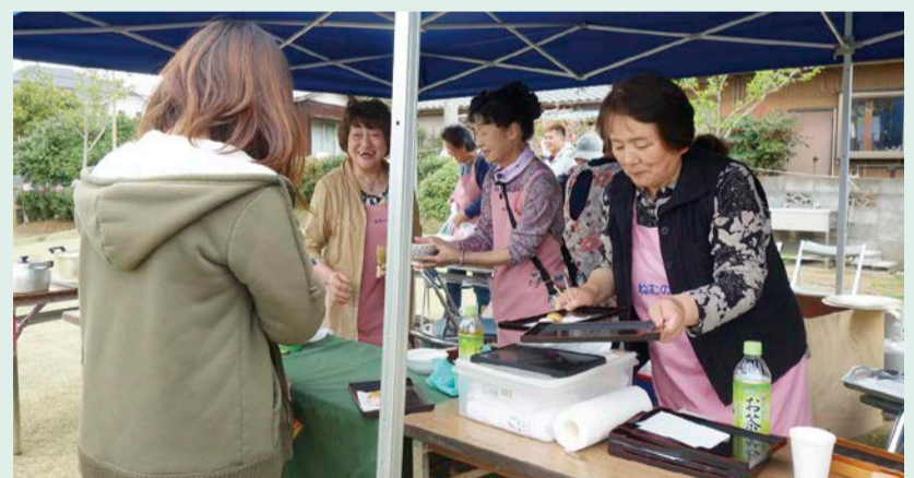
抹茶をふるまう、ねむの木会の皆さん

葉桜ではありませんでしたが、会場は焼きそば・フランクフルト・甘酒、ねむの木会の抹茶・まんじゅう・おでんなどの模擬店と、栗源地区住民自治協議会けやきサロンでは「おしぼりで作る動物」などが催され、会場は大いに賑わいました。