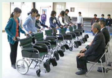
児童のみなさんより車いすが贈呈