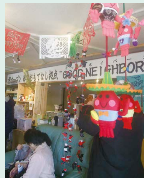
手づくりの飾りに囲まれた店内

こと。こうして完成した拠点「GOOD NEIGHBORS」は、早速、御宿町の子どもからお年寄りまで、「誰もが立ち寄れる居場所」となっています。朝はパンとコーヒーを食べてから出勤する人、昼間はお弁当を宅配してもらって話や手芸に夢中になる人、下校後に立ち寄って宿題をする学生などなど、たくさんの人たちに活用されています。同じものを香取市で…とまではいきませんが、「居場所づくり」「人と人との繋がり」など、たくさんのヒントを得た研修となりました。