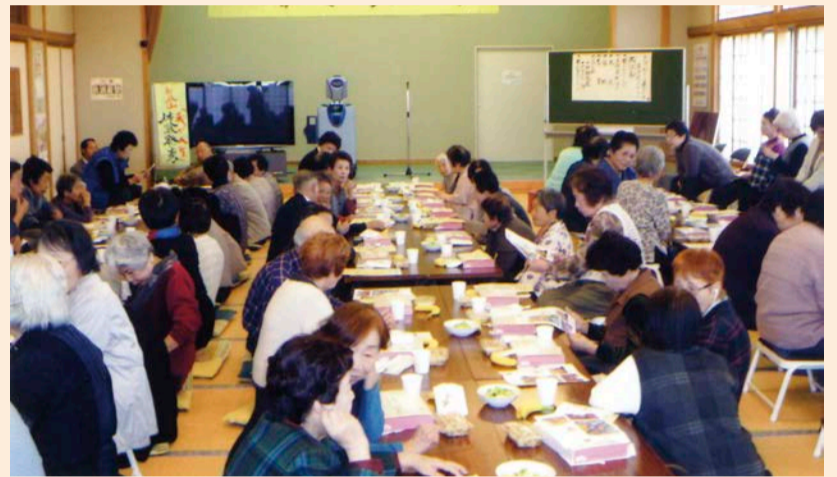
楽しいつどいに会話もはずむ

参加者によるカラオケや踊りの披露に会場は盛り上がり、特に今回初めて設けた「我が人生・体験発表」のコーナーでは、3人の方の貴重な体験発表に、皆さん楽しく興味深く耳を傾けていました。この事業は、平成元年から実施している「小見川チャリティーバザー」の資金協力(市民サイドによる)を得て実施されました。