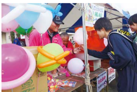
栗源のふるさと祭りの共同募金活動