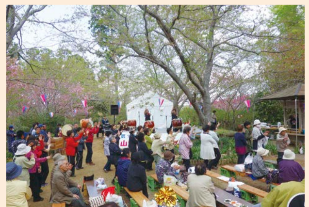
太鼓に合わせて山田音頭の輪♪