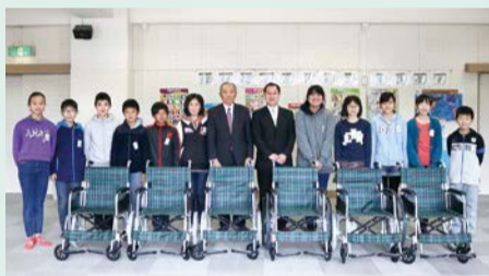
佐原小学校のみなさん ありがとうございます