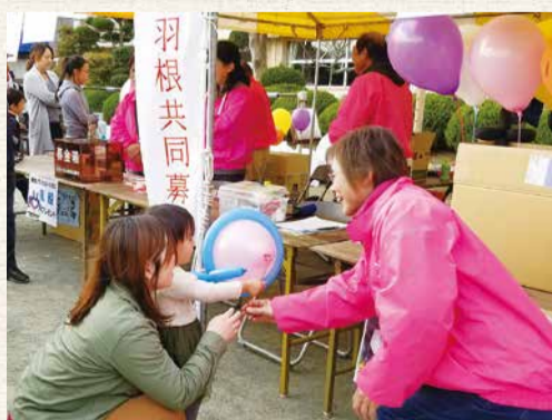
11月18日 栗源のふるさといも祭