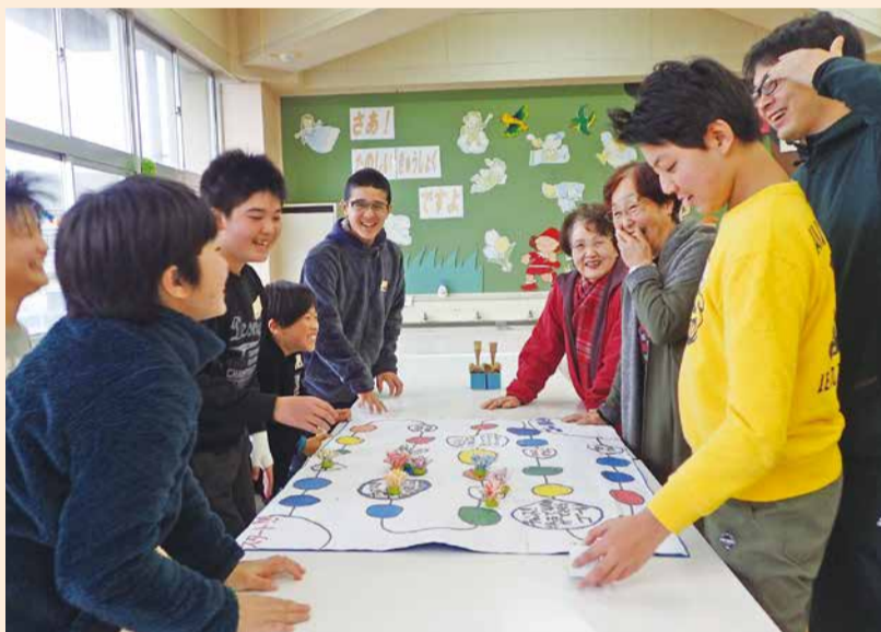
笑顔あふれるすごろく

当日は全員でジングルベルを合唱したり、一緒に会食をしたりと少し早いクリスマス会を楽しみました。そのほかすごろく、かるた、あやとりなどの昔ながらの遊びもしました。和気あいあいとした雰囲気の中、高齢者と児童との心温まる世代間交流となりました。