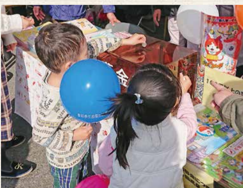
11月25日 ふるさとフェスタさわら