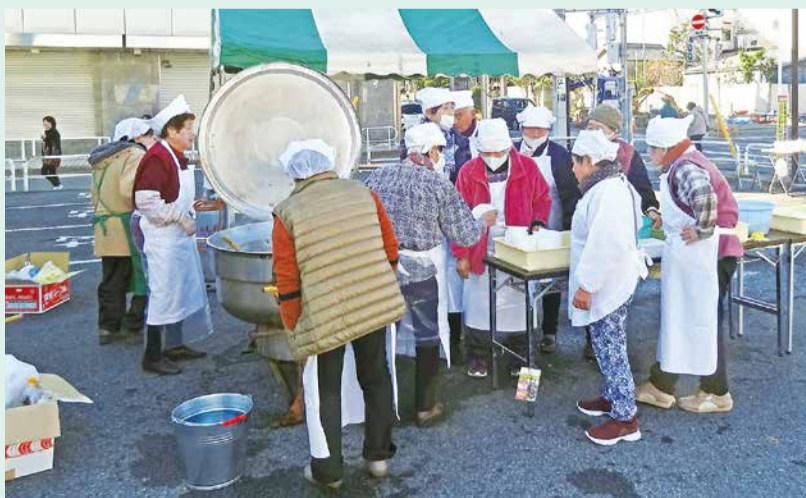
大きな鍋でグツグツと

主催は佐原新宿地区社協で、同役員とこれに賛同した当地区の高齢者クラブの有志10人の協力の下、開催しました。会が終了する午後3時ころまで、会場は笑顔にあふれ、楽しく有意義なひとときとなりました。