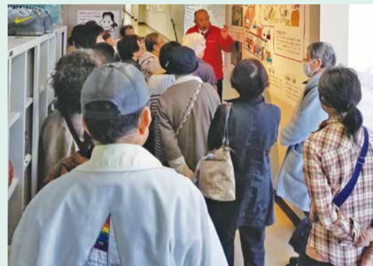
熱心に説明を聞く参加者のみなさん

1つずつトレーやカップに入れられてから発酵すること、機械化された中で人が行う厳密な検品。これほど手間を掛けて作られているのかと、驚きと発見の連続でした。最後は試食をさせていただき、直売店でお土産を購入しました。その後、道の駅たまつくりで昼食をとり、散策の後、帰路につきました。