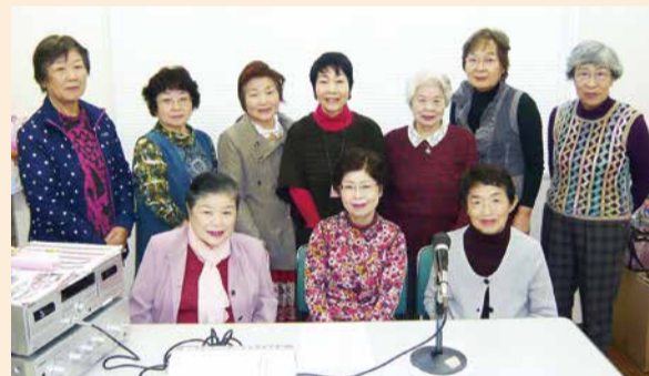
私達が「温かい声」をお届けしています

ベテラン揃いのメンバーさんが、まさに水面のように澄んだ声で吹き込んだ「声の広報」は、地域ボランティアの皆さんのご支援により配達され、利用者の方々は毎月その到着を心待ちにしています。