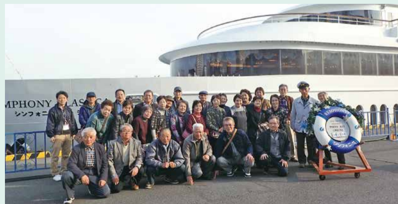
シンフォニーモデルナ号の前で記念撮影

会員同士の親睦を図りながら今後も地域のために活動してこうと、意識の高まる視察研修となりました。