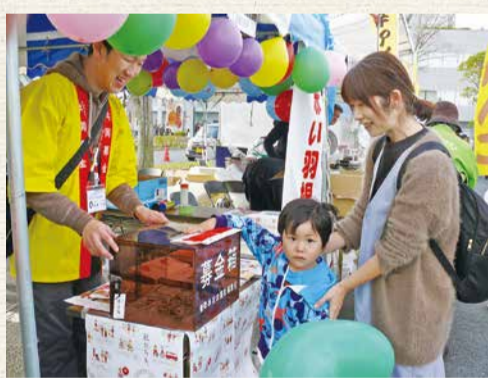
11月11日 おみがわ YOSAKOI ふるさとまつり