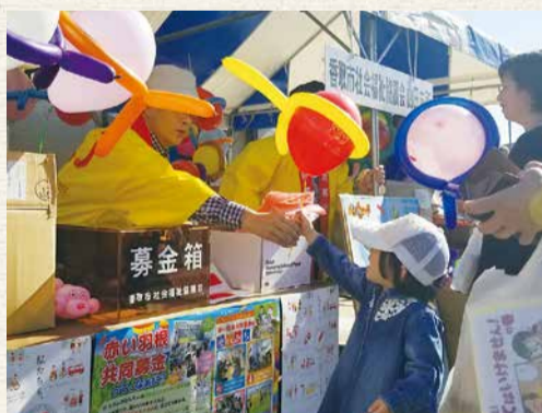
11月3日 山田ふれあいまつり