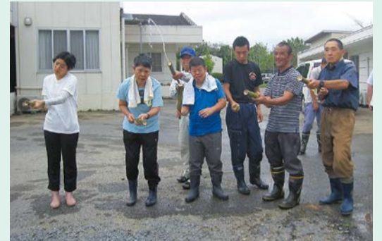
遠くまで飛んだかな？

ほかにも同グループは毎月4回程度、園生の園外散歩のお手伝いもしています。その他にはお年寄りの買い物支援や大工仕事のお手伝い等で喜ばれています。グループでは余生を福祉活動で楽しもうという方の参加をお待ちしています。