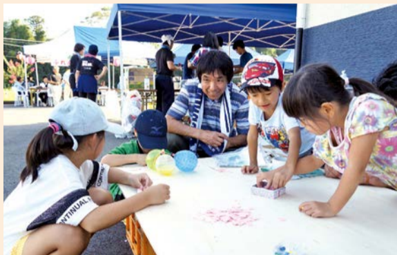
かたぬきを楽しむ子どもたち

8月25日、高萩コミュニティセンターにて高萩ふれあいまつり実行委員会主催の「高萩ふれあいまつり」が盛大に開催されました。