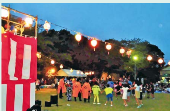
老若男女が輪になって

祭りの主役は子どもたち。神輿を担ぎながら団地内を練り歩く「子供水かけ祭り」からスタートします。勢いづいた子供たちは、午後からはさまざまなゲームに参加し、夕方からはお待ちかねの屋台が並ぶ縁日へ繰り出し、やがて盆踊りが始まります。よさこいやバンド演奏も加わり最高潮へ。そしてクライマックスの、やぐらからお宝が降ってくるイベントがスタート。「コンビニ袋を持参して」との事前周知のかいもあり、みんなお土産いっぱい帰路につきました。大勢の方々の協力により、世代を超えてたくさんの笑顔の花が咲きました。