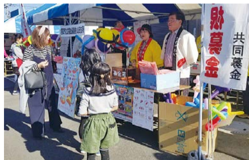
山田ふれあいまつりでの募金活動

10月1日から全国一斉に実施され、各自治会を通じて寄せられる各世帯からの募金をはじめ、企業などの法人、学校、公共機関、協力店、福祉施設などのご協力により募金活動を行います。