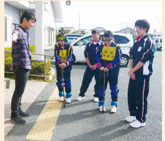
高齢者の大変さを体験

朝夕の冷え込みが増す11月13日、小見川中学校2年生4人が「社会体験学習」として小見川社会福祉センターさくら館へ来館しました。車いす介助や入浴介助、福祉作業所での作業など、福祉の現場を肌で感じながら体験しました。