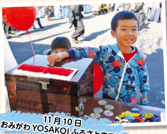
11月10日 おみがわYOSAKOIふるさとまつり