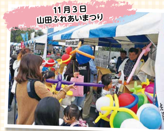
11月3日 山田ふれあいまつり

昨年10月から12月にかけて実施した共同募金活動に、大勢の方々からたくさんの募金が寄せられました。また、各地区で行われたイベント会場では街頭募金も実施しました。