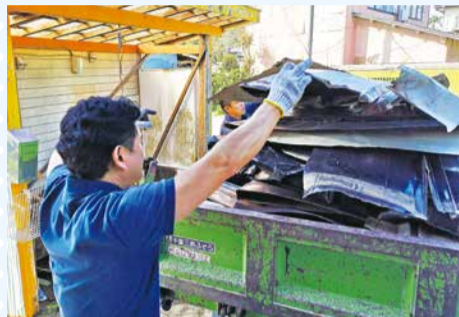
落ちたトタン屋根を搬出