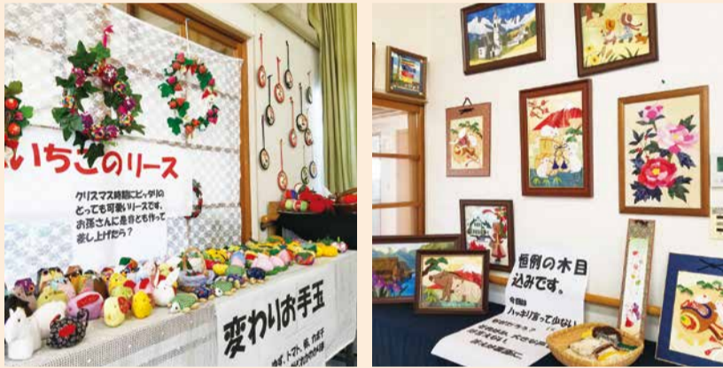
ステキな作品が目白押し

会場には、可愛らしい「イチゴのリース」、動物や野菜などをかたどった「変わりお手玉」、美しい絵画のような「木目込み」、和柄のカラフルな布をあしらった「お菓子皿」などの作品が、所狭しと並べられていました。制作に携わった人たちも集まって、来場者に丁寧に説明をしてくれました。制作者のひとは、「同じものを作っても一人ひとりの個性が出て、趣が違う作品ができるところがとても楽しいのよ」と作品への愛情を込めて話していました。