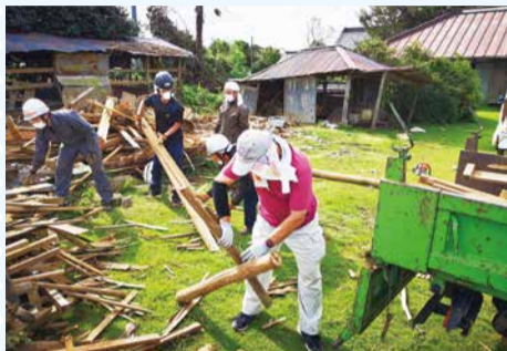
倒壊した倉庫のがれき撤去