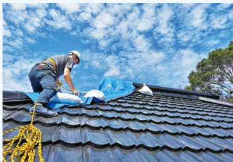
屋根のブルーシート張り

災害は無いに越したことはありません。しかし、いつどのような形で襲ってくるかは誰にも分からないことです。これからもこの経験を生かし、皆さまのお役に立てるよう備えてまいりたいと考えています。 (香取市災害ボランティアセンター職員)