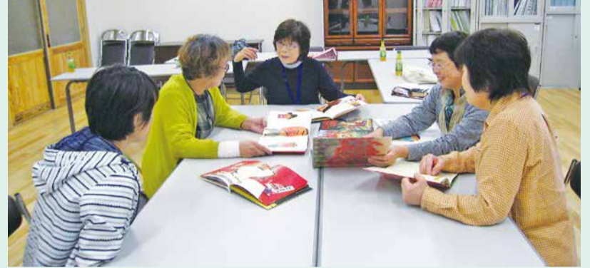
絵本選びも活動のひとつ

今年度開校した山田小学校では、山田地域内の小学校で活動していたメンバーが月2回集い、本の読み聞かせを行っています。低学年には楽しく分かりやすい本を、高学年には国や文化を超えたグローバルな本を、また四季折々の風景や行事を感じられる本など、毎回本選びから読み聞かせまで6人で楽しく活動しています。活動メンバーのひとは「本を通じて、子どもたちの平和な心や夢と希望を育めたら幸いです」と語ってくれました。