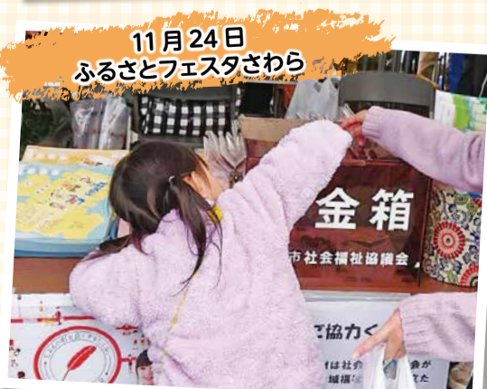
11月24日 ふるさとフェスタさくら