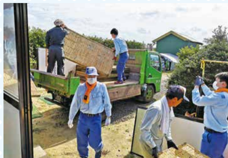
雨漏りで腐った畳を搬出