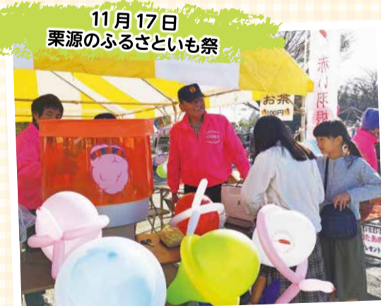
11月17日 栗源のふるさと祭り