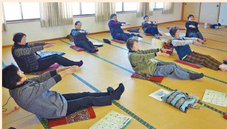
歌いながら体操するのがポイント!

懐かしの童謡を口ずさみながら、座ったままゆっくり手や足を動かす「香取もりもり体操」は、山田区内でも人気急上昇です。「ここに来てみんなと一緒に体操しておしゃべりも出来て楽しいよ～。こういう場所を作ってくれてありがとう」「もりもり体操で少しずつ貯めた貯筋で、みんなでウォーキングに行きたいね～」と参加者の方から嬉しい声もいただきました。山田区内では、吉野平・仁良・神生・長岡・入小保内・山倉と地域の集会所等を利用して活動されています。いつまでも、住み慣れた地域で、元気に!! もりもり体操の輪が広がりますように。