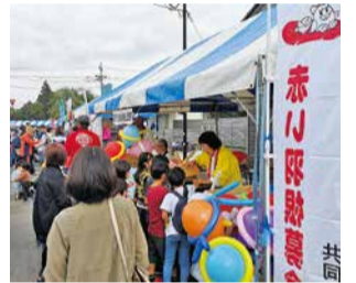
山田ふれあいまつりでの共同募金活動