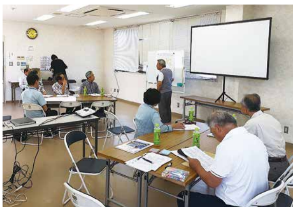
生活支援体制整備事業(小見川東南地区協議体)

介護保険事業が、数年来本会の経営全体を圧迫しているのが現状となっており、この状態のままでは社会福祉事業に悪影響を及ぼすことも考えられます。事業撤退も含めた決断を迫られるおそれもありますが、事業継続中であり利用者第一をモットーとしたサービス提供に努めるとともに、執行予算の縮減を図ってまいります。そのため、ホームヘルパーの資質やサービス向上等の研修や管理体制の整備を進めてまいります。