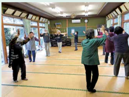
山田愛が詰まった「山田音頭♪」

山倉集落センターでは、山倉・大角住民自治協議会主催で毎週水曜日午後1時半から介護予防を目的に「香取もりもり体操」の他、ぬり絵、ボールやラップの芯を利用した身近で簡単にできる運動など、毎回趣向を凝らした楽しい活動をしています。休憩が終わり、締めはみんなで輪になって踊る「山田音頭♪」。毎年4月に開催される春祭りでも子供から大人まで大勢で踊るそうです。コロナ禍で祭りは中止になりましたが、地域の皆さんで伐採や草取り等、管理しているという地域の方の思いが詰まった「さくらの山」には今年も桜の花が彩を添えてくれました。