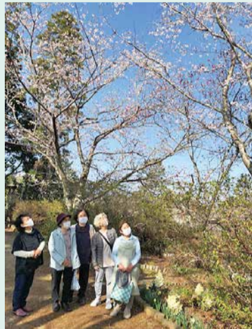
さくらの名所「さくらの山(山倉)」