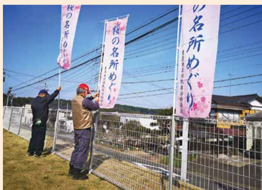
のぼり旗の取り付け

残念ながら今年も「お花見広場」は、新型コロナウイルス感染拡大予防のため、中止となってしまいましたが、「地域の皆さんには満開に咲いた桜が丘広場の桜でお花見を楽しんでもらいたい！」という想いを込めて作業が行われました。