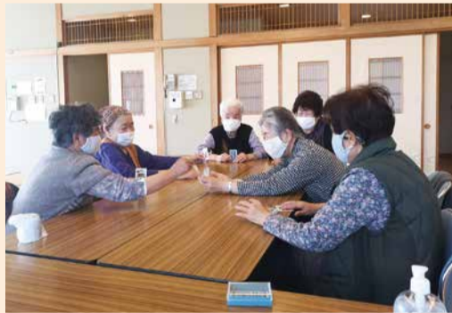
トランプを楽しむ会員の皆さん

内容は、最初に全員で“もりもり体操”をした後、手芸やトランプなど各々が好きな過ごし方で一日を過ごします。フレイル予防や、認知症の予防にも非常に効果的です。ひめの会の皆さんは「一人暮らしだと会話することが少ないので、体操やおしゃべりが出来る場所があってとても助かる！」と笑顔で語ってくれました。