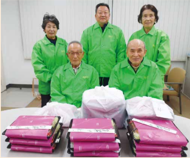
愛情いっぱいの弁当をお届けします

道の駅くりもと、美人の湯カーニバルヒルズ、キッチン啓花で作られた愛情いっぱいのおいしい出来たての夕食を月2回、見守り・声掛けを兼ねて自宅まで届けています。