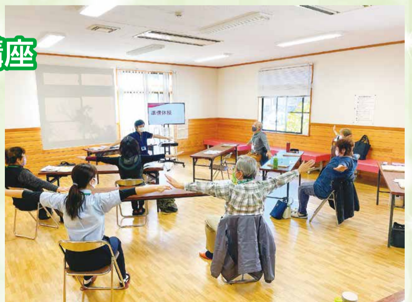
準備体操を余念なく