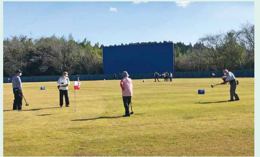
ポスト目がけてナイスショット!!