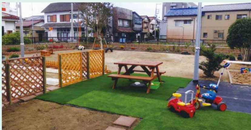
お庭を開放中。皆さまご利用ください