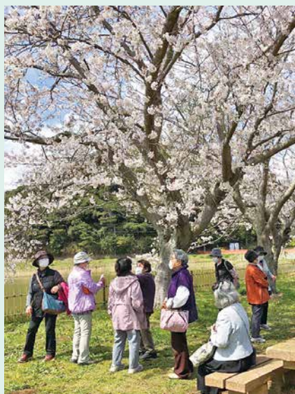
満開の桜の下での楽しいひと時

月2回、長岡青年館でもりもり体操を中心としたサロン活動をしている「長岡にこここクラブ」。4月6日は、青年館から送迎バスに乗り、会場をテラス・サンサンに移しての開催です。体操の後は久しぶりに訪れた橘ふれあい公園を散歩しながら思い出話に花が咲きました。今日は送迎バスに乗ってちょっとお出かけ気分!! 「桜も満開で気持ちのいい青空。ほんとに今日はいい日だね!!」と皆さんがニコニコ笑顔で話してくれました。