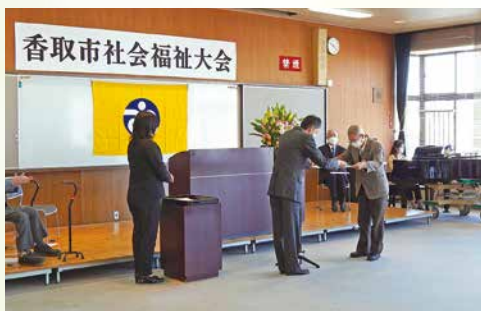
会長からの表彰状授与