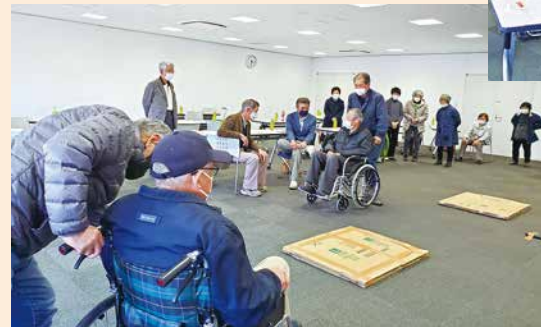
車いすで段差を乗り越えよう!