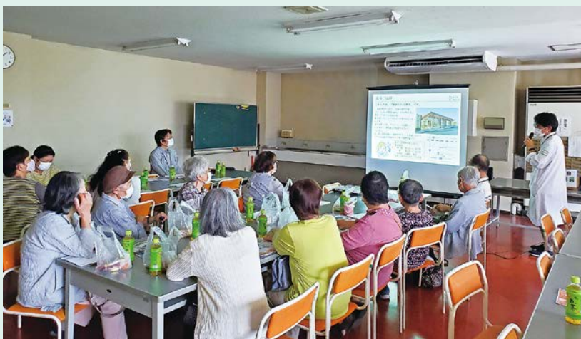
スライドを使っでの説明に真剣に聞き入る参加者

また、オンライン服薬指導という、スマホとパソコンをつないだ状態で薬の説明や質問などができるサービスの実演もあり、参加された皆さんは画面を通したやりとりを見て、驚きながらも楽しく学びました。皆さんが薬に関する知識を深められ、さらに健康パワーをアップさせるお手伝いのできたらいいなと思いました。