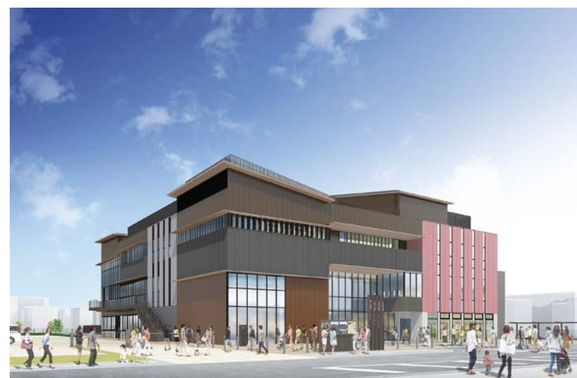
みんなの賑わい交流拠点 コンパス 完成イメージパース