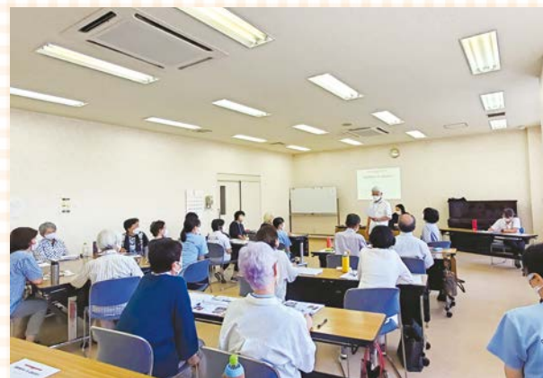
発表者の意見を真剣に聞く参加者(小見川会場)