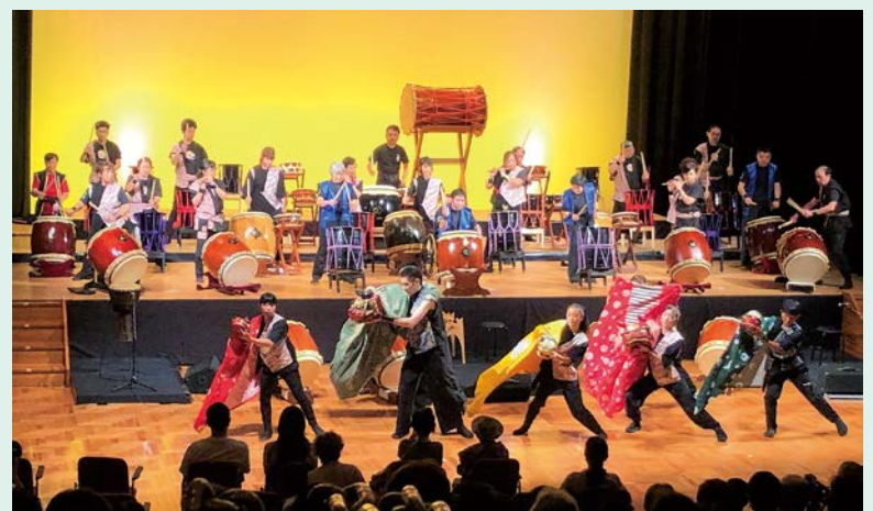
迫力ある太鼓の音色と獅子舞