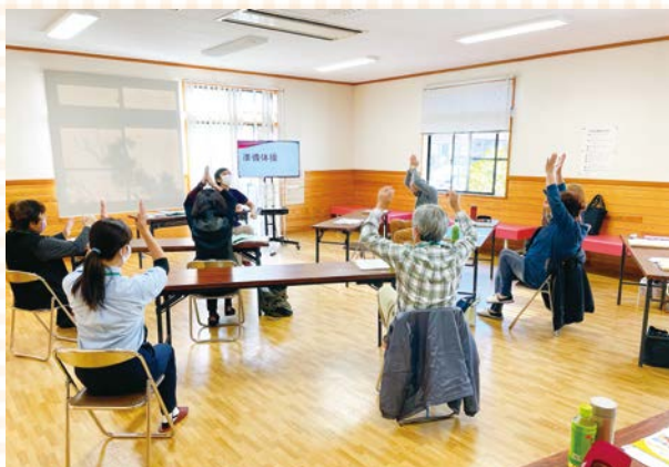
まずは準備体操(佐原会場)

介護予防や認知症予防にもつながる内容となっていますので、高齢者の方も奮ってご参加ください。