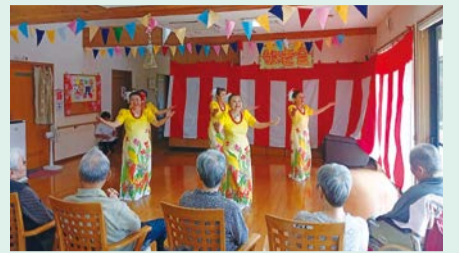
▲ウコンの花の咲く美しさの表現

すてきな衣装と優雅で流れるような振り付けもさることながら、フラを踊る皆さんの笑顔に魅せられ、会場は温かな雰囲気になりました。