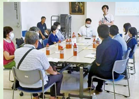
障害のある子を持つ家族同士の交流会

当日は、いろいろな体験を通じて活動団体同士の交流や多分野の活動を知る機会となりました。今回できたつながりを大事にしながら、新たな地域づくりを広げていきたいと思えます。