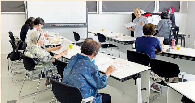
懐かしのメロディーをみんなで口ずさむ

おれんじ喫茶は、どなたでも気軽に立ち寄れる集いの場です。月1回開催しており、おしゃべりや音楽、健康体操なども楽しめます。ぜひ気軽にお越しください。