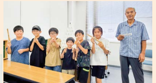
▲完成した輪ゴム鉄砲を手に