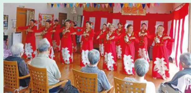
◀最後は全員で「南国の夜」を披露