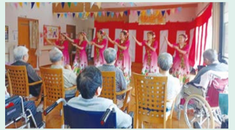
▲コナ島へくる旅行者たちへの歓迎の心