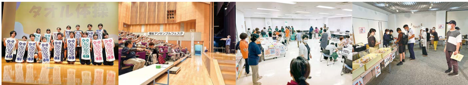
高校生ボランティアの皆さん