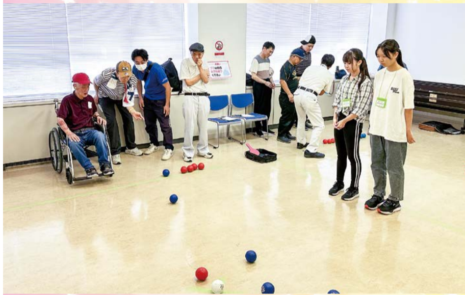
年齢や障害の有無に関わらず楽しめたボッチャ