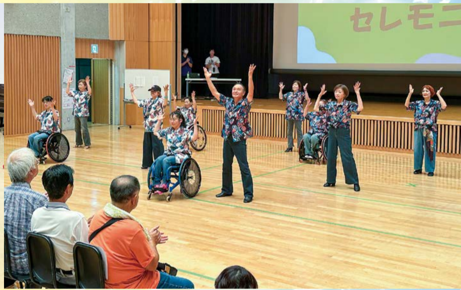
オープニングを飾ったウィルチェアダンス研究会クアルト