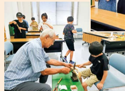
◀トンカチを使って釘を打ち、パーツを組み立てる