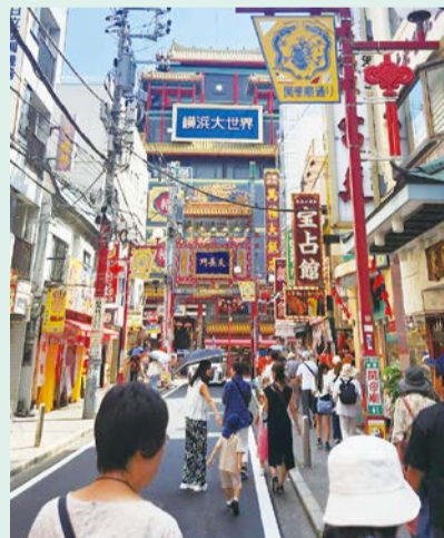
横浜中華街を散策