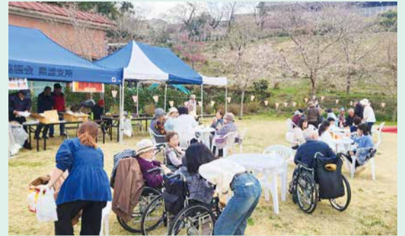
桜のつぼみがほころび春を感じる催しに

また、共催の栗源住民自治協議会「けやきサロン」では、お茶やコーヒーのサービスが提供されました。桜は満開には至りませんでしたでしたが、春の訪れを感じる心温まる催しとなりました。