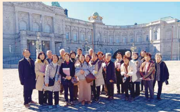
迎賓館赤坂離宮をバックに

迎賓館は、皇太子の住まいとして建設された歴史ある建物で、入館時に受けた多くの注意事項に緊張しつつも、館内に足を踏み入れると、その豪華絢爛な空間に魅了され、優雅で穏やかなひとときを過ごしました。当日は市のいびき号を利用し、移動中の車