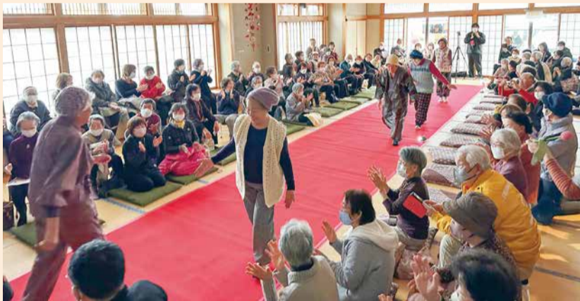
みんなが輝いていたファッションショー

この一日が、これからの生きがい、楽しみ、支えあいにつながるきっかけになればと思います。