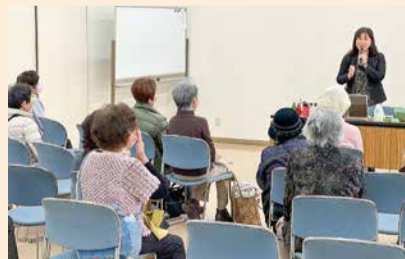
AZAREによるナチュラルメイク講座