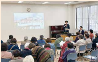
ちばぎん相続セミナー