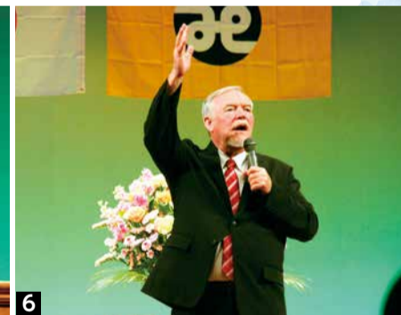
1竹蓋会長の主催者あいさつ 2竹蓋会長から表彰状の授与 3伊藤香取市長による来賓祝辞 45香取市作文コンテスト最優秀賞受賞作品を発表する受賞者 6記念講演で話芸を披露するダニエル・カール氏