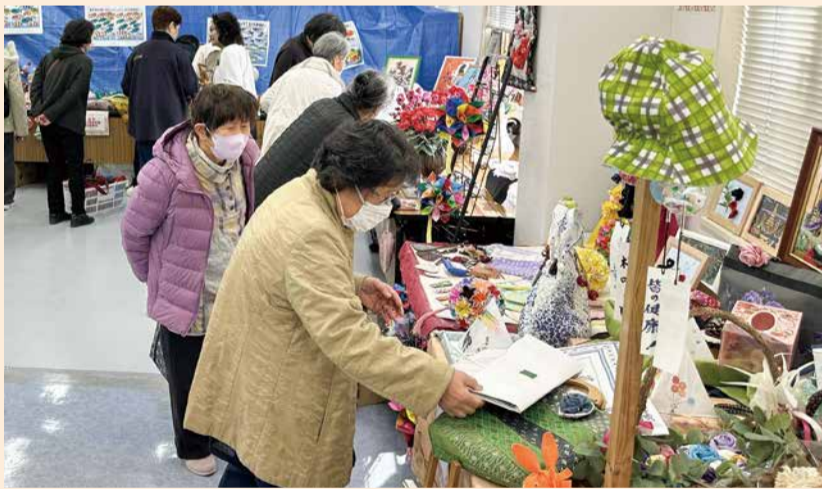
ステキな作品が並んだ作品展示ブース