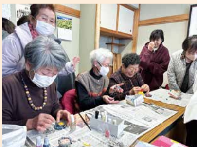
夢☆くりもとのワークショップ