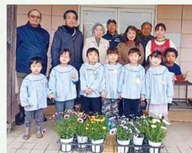
風のこ・府馬っこ・元気っこ！ (府馬保育園)

続いて、介護老人保健施設おおくすの郷を訪問しました。利用者の皆さまがいつまでもお元気に過ごされ、寄贈した花々で心とむひとときとなれば幸いです。