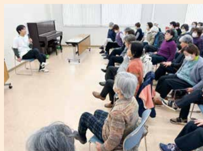
NEXTかとりによる介護予防講座