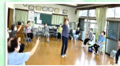
じゃんけん大会の景品は...