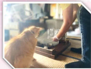
ごはんの用意ができるまで...

入院によって自宅が不在となる為、飼い猫の世話に困っていた高齢者を期間限定でお手伝い。ボランティア登録者とご近所の皆さんでごはんを届けました。