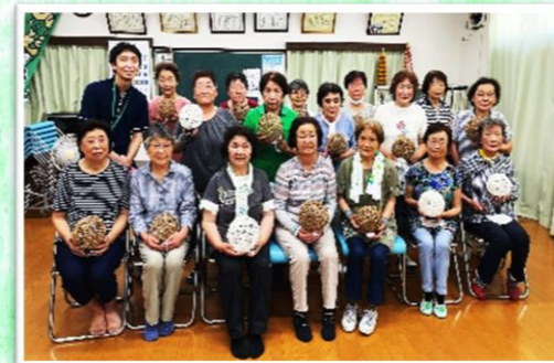
紙ひもでランプを作りました