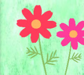
みんなで植えたコスモスの前で