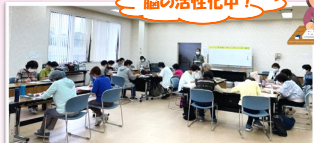
点つなぎドリルに挑戦中!! 「投了」の出来上がり