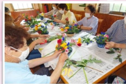
花の持ち味を引き出してアレンジ

9月より毎週火曜日に地域サロンとして開始しました。初回は「フラワーアレンジメント体験」を実施し、参加者の皆さんは色とりどりの花を用いたの作品づくりを楽しまれました。今後も香取もりもり体操をはじめ、様々な行事を予定しています。