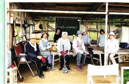
みんなが集う場所