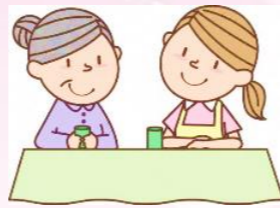
少し話ができると安心です