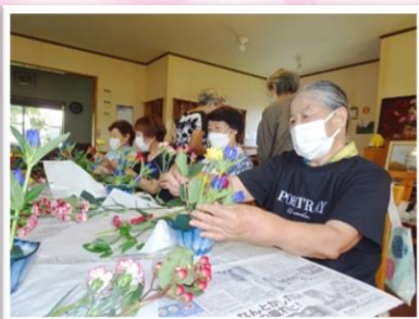
真剣な眼差しで作品作りに励む皆さん

9月より毎週火曜日に地域サロンとして開始しました。初回は「フラワーアレンジメント体験」を実施し、参加者の皆さんは色とりどりの花を用いたの作品づくりを楽しまれました。今後も香取もりもり体操をはじめ、様々な行事を予定しています。