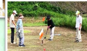
ホールの旗はお手製!

高齢者クラブや他の団体と連携を図りながら、グラウンドゴルフの練習と広大な広場の除草作業、花植え等を行っています。おしゃべりを楽しみたい方、健康のために運動したい方、作業にご協力いただける方、お待ちしております!