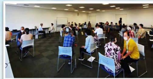
2人組でのロールプレイ

昨今のコロナ禍により、心身共に不調をきたす方が増えています。そのような方へのサポートとして、香取市ボランティア連絡協議会の「傾聴ボランティア養成講座」とも連携し、今後、地域のニーズに応じていけるよう活動していきますので、お気軽にご相談ください。