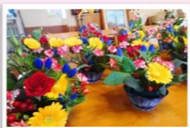
色鮮やかな花々が彩る素敵な作品達