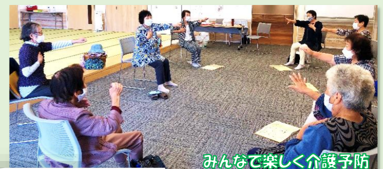
みんなで楽しく介護予防

ここに来ると「元気になる・楽しくなる・前向きになる・足腰が強くなる・嬉しくなる…等々」参加者全員が役割を持ち、ひとりひとりの個性が光る「なるなるサロン」。体操の他、チラシ・牛乳パック、洋服や着物を再利用した小物作りにそれぞれが励んでいます。制作したものを身に着けたり、置物として活用したりし、完成の喜びと満足感でいっぱいです。