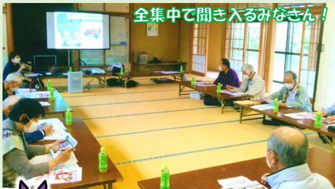
全集中で聞き入るみなさん！

活動に参加したい！知りたい！などございましたら、裏面記載のコーディネーターへどうぞ！