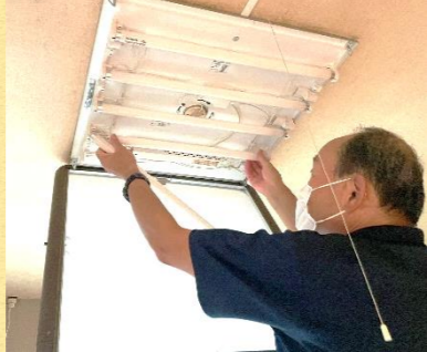
蛍光灯の交換作業

高齢者の「ちょっとした困り事」のお手伝いをしています。 「足のケガで犬の散歩に行けない」「蛍光灯の交換ができない」地域の困りごとにボランティアさんが駆け付けました！