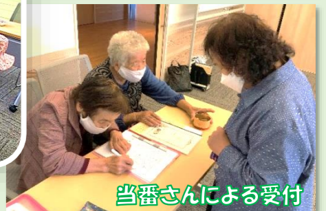
当番さんによる受付