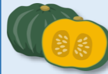
材料のカボチャを下さりうえ