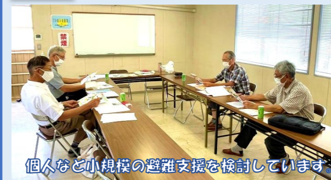
個人など小規模の避難支援を検討しています