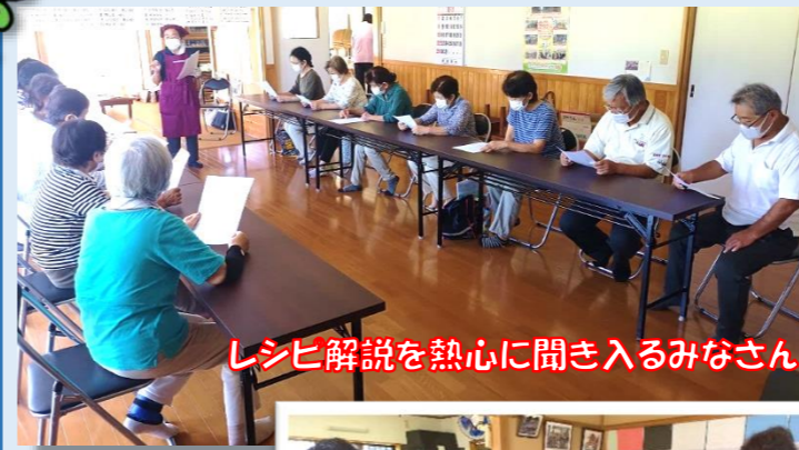
レシビ解説を熱心に聞き入るみなさん