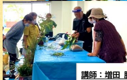
講師の指導に興味津々でした！