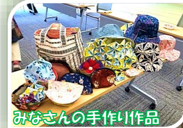
みなさんの手作り作品